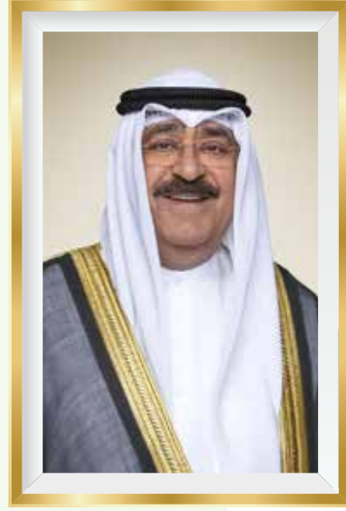
حضرة صاحب السمو الشيخ مشعل الأحمد الجابر الصباح أمير دولة الكويت