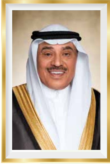
سمو الشيخ صباح خالد الحمد الصباح ولي عهد دولة الكويت