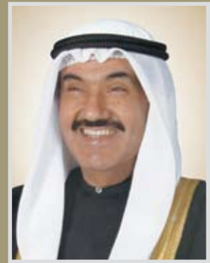
سمو الشيخ فهد بن محمد الجابر بن جابر رئيس مجلس الوزراء - دولة الكويت