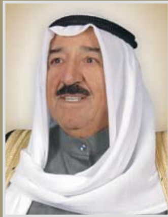
حضرة صاحب السمو الشيخ جابر بن مبارك الجابر أمير دولة الكويت