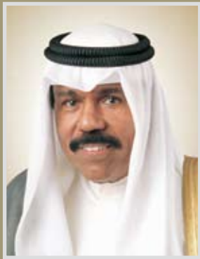
سمو الشيخ نواف بن عبد اللطيف الجابر ولي عهد دولة الكويت