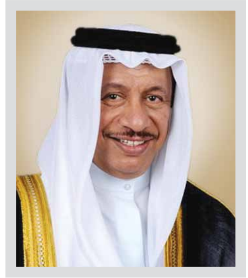
سمو الشيخ جابر مبارك الحمد الصباح رئيس مجلس الوزراء