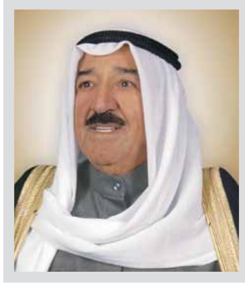
صاحب السمو الشيخ صباح الأحمد الجابر الصباح أمير دولة الكويت