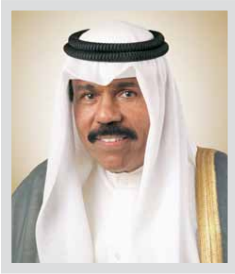
سمو الشيخ نواف الأحمد الجابر الصباح ولي العهد